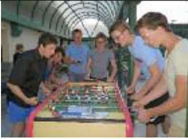
Auch am Boden immer aktiv