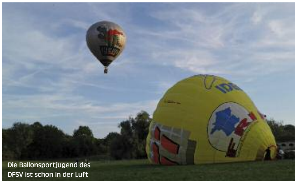
Die Ballonsportjugend des DFSV ist schon in der Luft