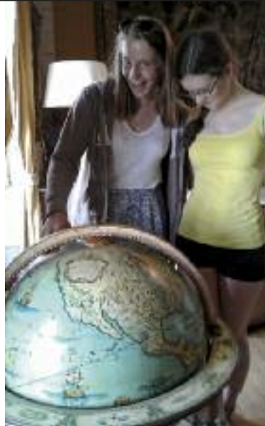
Werden hier am Globus bereits größere Fahrten geplant?