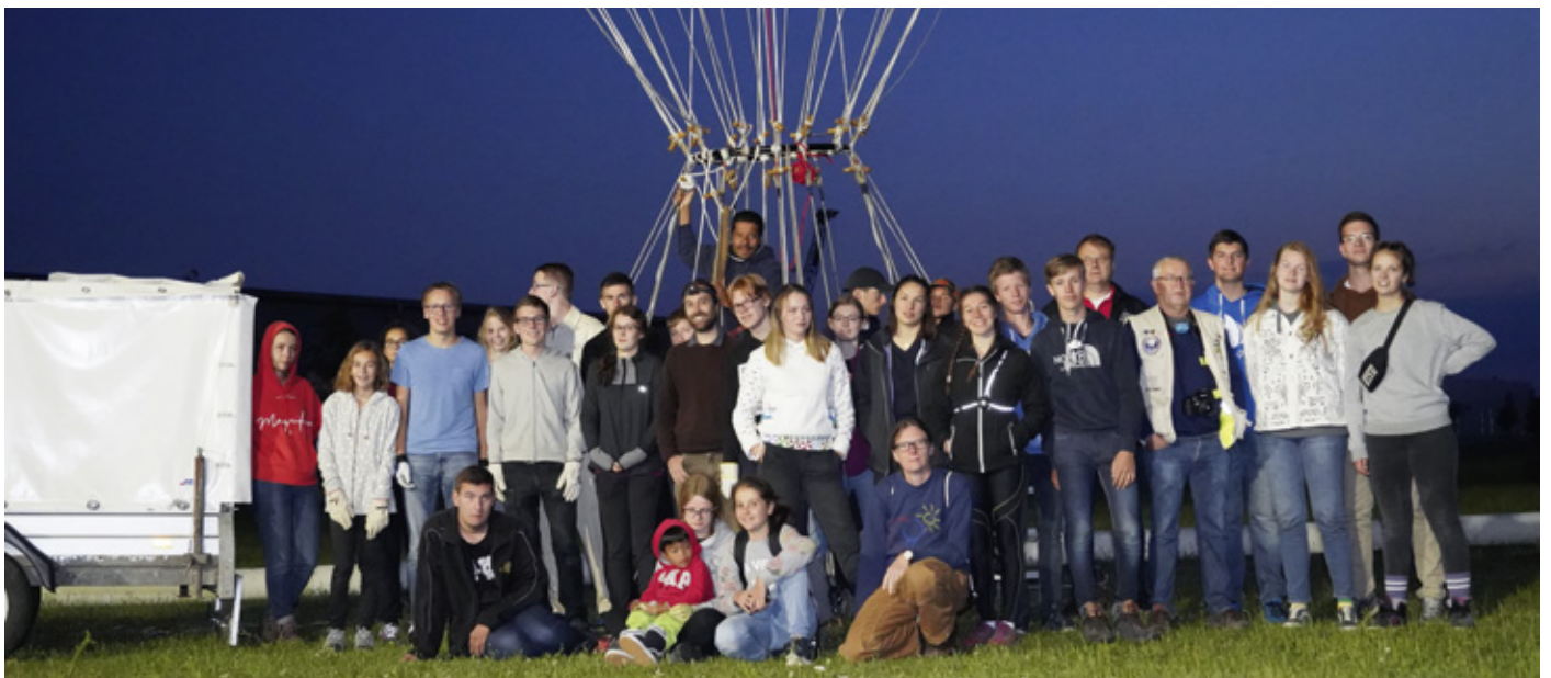
Gruppenfoto vor dem Gasballonstart auf dem Startplatz Via Claudia des Freiballonvereins Augsburg

Die Jugendlager des Deutsch-Französischen Jugendwerks (DFJW) finden im Wechsel in Frankreich und Deutschland statt, und dieses Jahr waren wieder wir die Gastgeber. Zu unseren Heißluftballonfahrten starteten wir in Oxenbronn, und zu den Gasballonfahrten von der Via Claudia in Gersthofen.