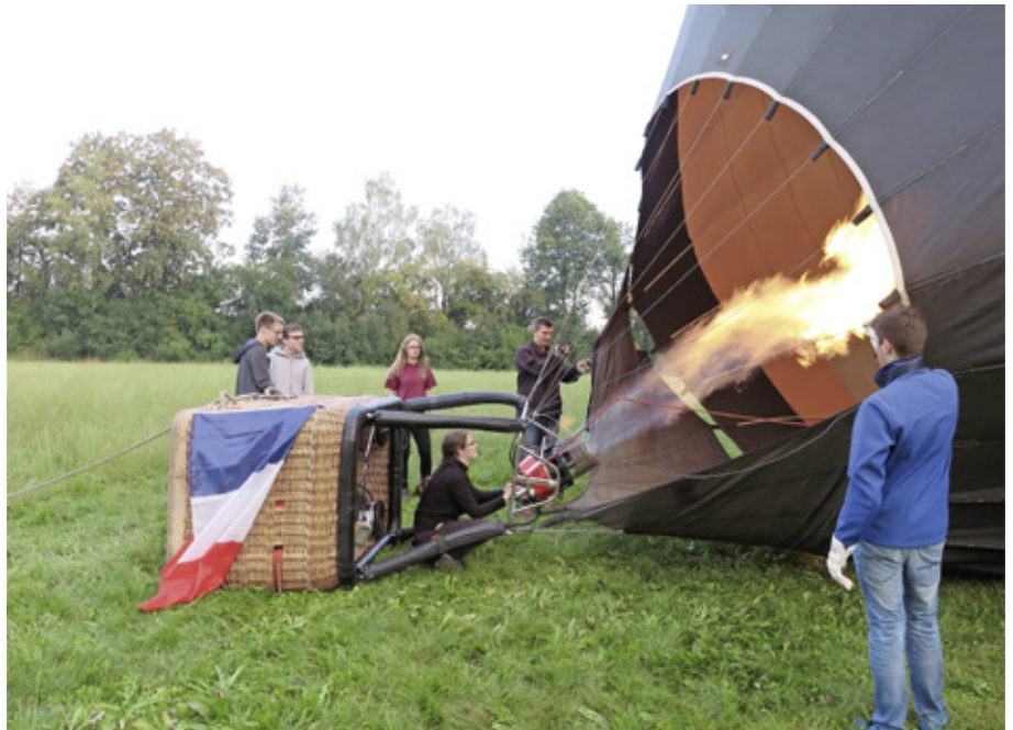
Beim Aufheizen der Hülle

Das Feedback der Teilnehmer war überwiegend positiv – wir nutzten hier erstmals das Auswerteprogramm i-eval.eu. Es war möglich, dass alle mehrfach im Ballon mitfahren konnten, und ganz wichtig, dass auch alle im Gasballon mitfahren konnten. Herzlichen Dank an alle die dieses Jugendlager möglich gemacht haben: dem Deutsch-Französischen Ju-